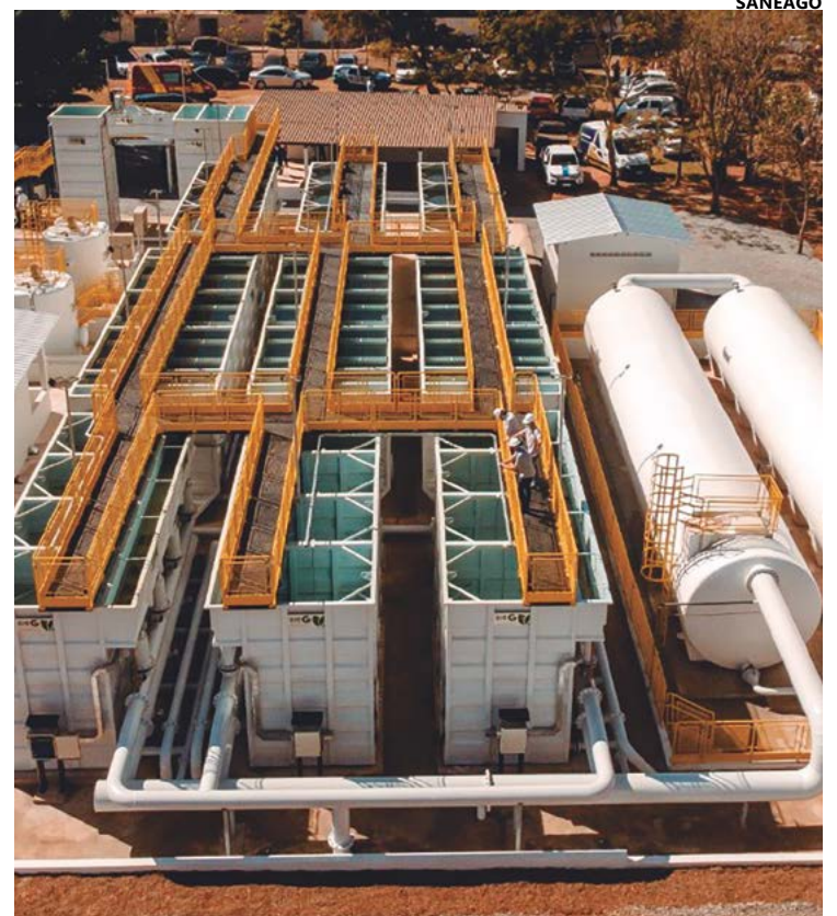
Expansão do sistema de tratamento tem objetivo de dobrar a capacidade

Há quatro anos, Anápolis tinha uma carência na área de saneamento hídrico, porém, o planejamento incluiu também ações para ampliar a rede de esgotamento sanitário. A Saneago detalha que já foram investidos R$ 69 milhões em esgoto, ampliando, desta forma, o atendimento para mais de 70 mil pessoas. Há ainda a previsão de outros R$ 67 milhões em obras, já contratados, para ampliação e melhorias da Estação de Tratamento de Esgoto (ETE) e construção de novos 200 km de