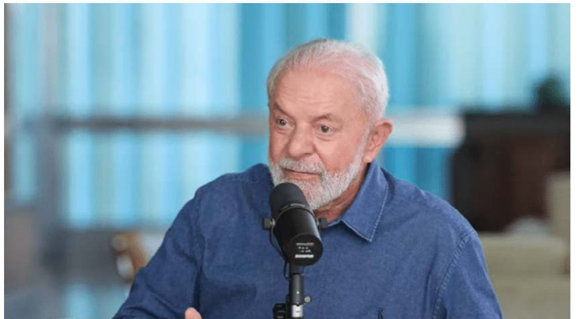
Lula da Silva: cresce aprovação do governo após um ano

A aprovação ao governo Lula é maior entre católicos. Em janeiro de 2024, 59% dos católicos afirmaram aprovar a gestão do petista, ante 35% de entrevistados que desapro-