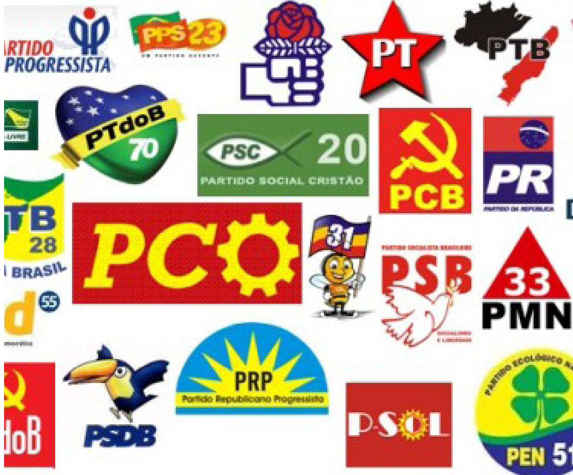
Partidos políticos: lei prevê recursos para fortalecer negros e mulheres nas eleições municipais

A regra também deve reduzir as cifras do PL, partido do ex-presidente Jair Bolsonaro,