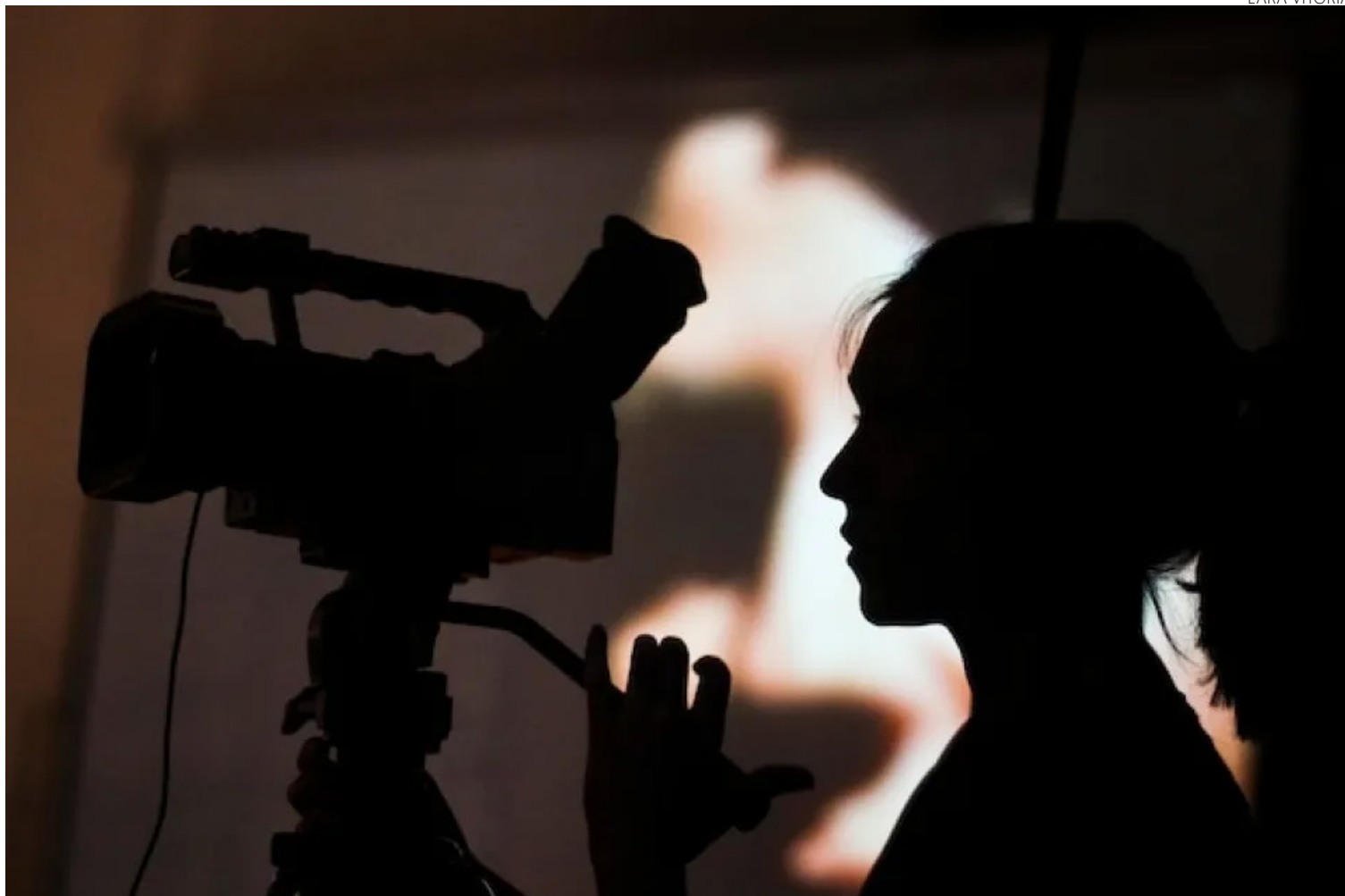
Desigualdade: pesquisa aponta que maioria das equipes ainda é constituída por homens

De acordo com a agência reguladora do cinema brasileiro, 75,4% dos títulos ficaram na mão de homens brancos e 19,7% foram feitos por mulheres