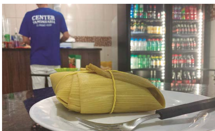
Localizada no coração da cidade, a Center Pamonharia busca inovações para adaptar as tradições às novas pedidas do consumidor

"O local ajuda sim a atrair mais clientes, demais. Mas a tradição que conquistamos também, quando a gente faz um produto bom e que as pessoas conhecem, elas sempre vão vir novamente e o nosso já tem mais de 30 anos, então a procura