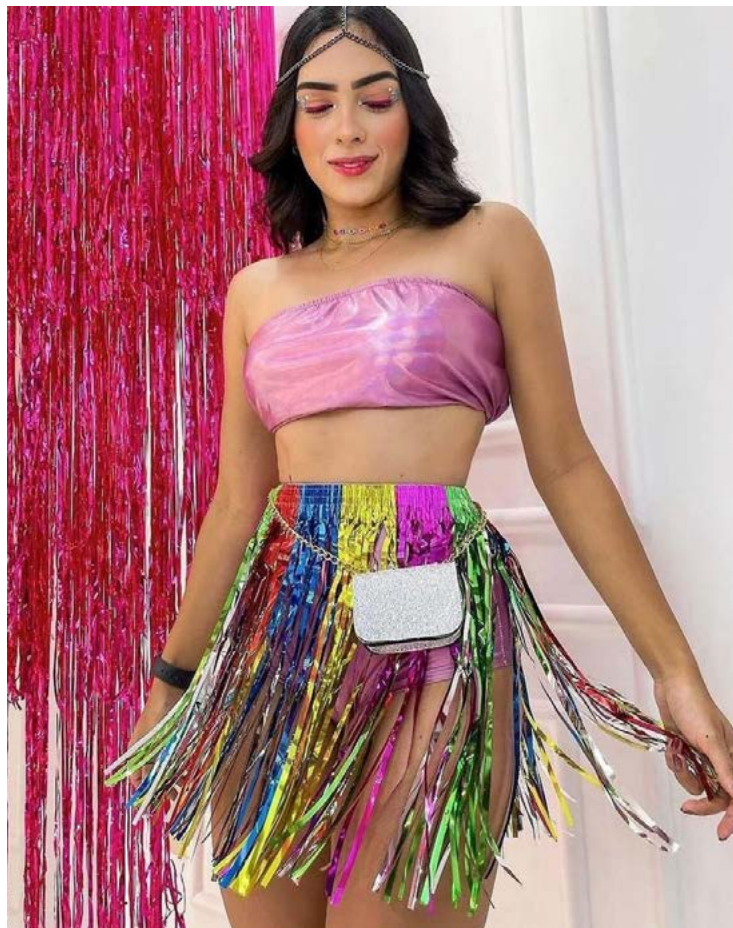
Lojas prepararam roupas especiais, fantasias e acessórios para a folia

Um estabelecimento que já está a todo vapor nas preparações para o carnaval é o Clube da Costura, espaço colaborativo de moda e que oferece ajus-