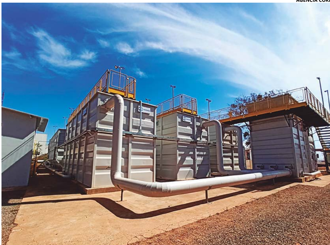
O primeiro e segundo lote de obras, que também incluíam outras medidas, foram concluídos em março de 2023

“Nós temos o objetivo de devolver a água na melhor qualidade possível. Esse investimento é constante, por causa da necessidade que a cidade tinha, depois disso vamos passar a cuidar do que nós chamamos de crescimento vegetativo que é o crescimento do dia a dia. Não só isso, mas quando surgir novas tecnologias sempre iremos aplicar”, finalizou.