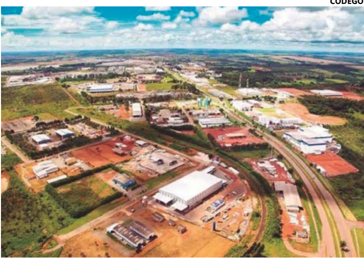
Recursos serão aplicados em melhorias no sistema de água tratada e no também para otimizar o tratamento de resíduos industriais

17 milhões para ampliação do Sistema de Abastecimento de Água do Daia, para a construção de reservatórios metálicos; R$ 7 milhões para reforma e ampliação da capacidade do sistema de tratamento de resíduos industriais em receber efluentes, que será de 250 l/s (o dobro da capacidade atual), e R$ 1,8 milhão na iluminação. Conforme o edital, o eixo principal que corta o Daia, a GO-330, terá a iluminação revitalizada com luminárias em LED. O serviço será executado em aproximadamente seis quilômetros da rodovia estadual para promover mais segurança e conforto àqueles que transitam diariamente pelo polo. DAIAPLAM A expectativa é garantir um salto de desenvolvimento para o estado, já que até 200 novos empreendimentos podem ser instalados no DaiaPlam, novo distrito de Anápolis, considerado