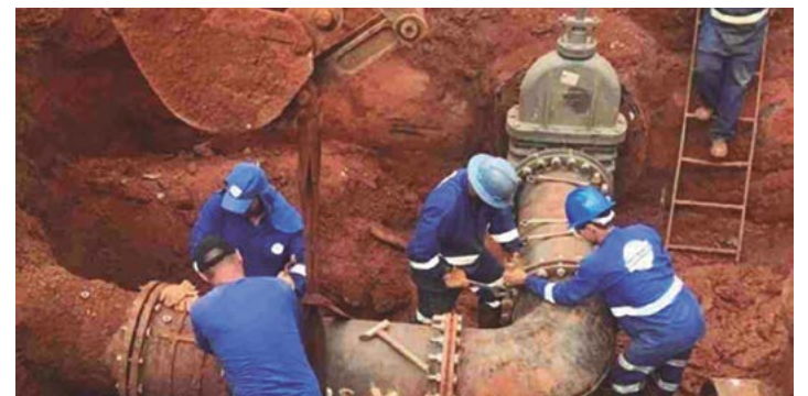
Dentro das intervenções previstas para universalizar e melhorar a rede de esgotamento, está a implementação do tratamento terciário