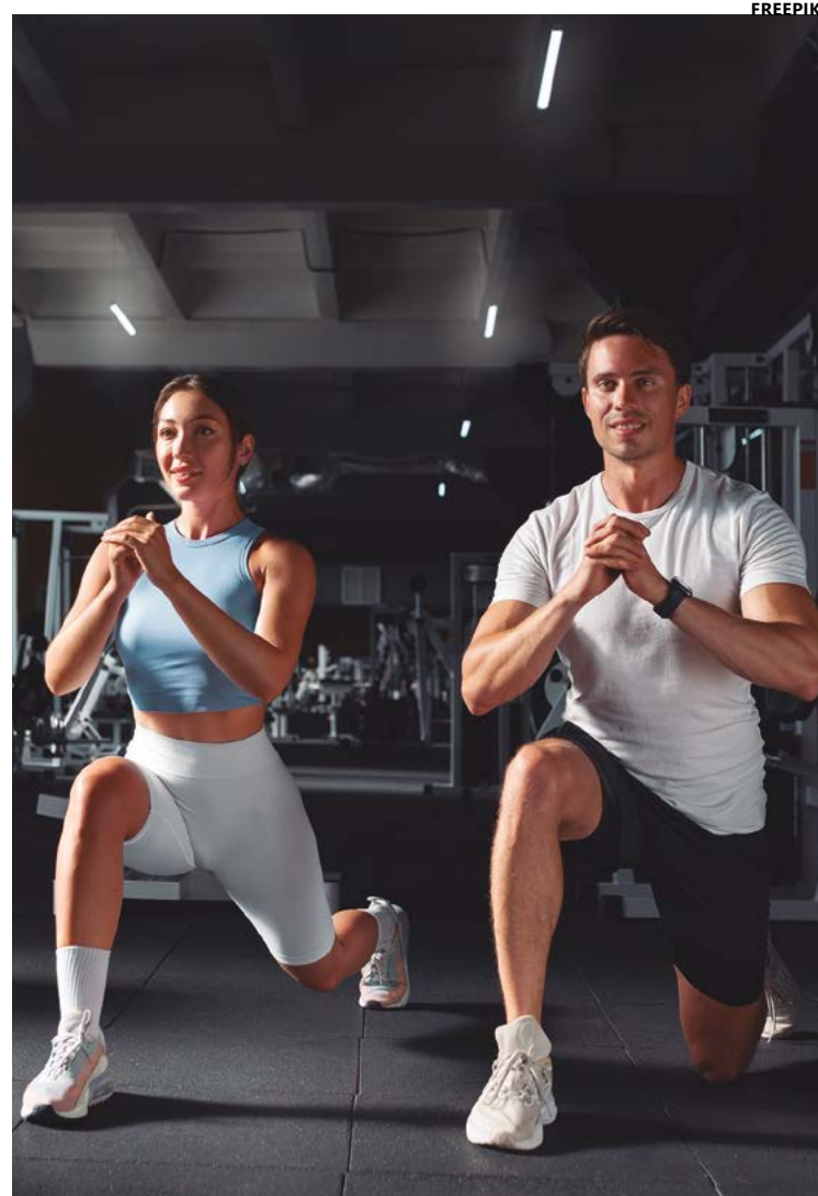
Frequência tem aumentado com promoção de aulas e eventos especiais