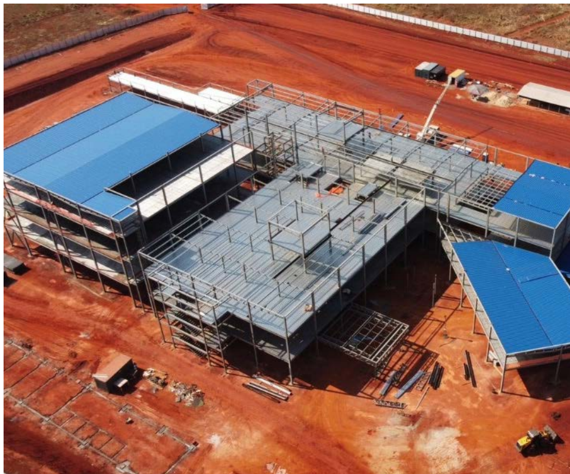
Complexo Oncológico de Referência do Estado de Goiás (Cora): hospital público voltado ao tratamento contra o câncer

“A celebração de parcerias para a prestação de serviços públicos de saúde, por meio de gestão por colaboração, com a iniciativa privada não encontra vedação na Constituição Federal, conforme já assentado pelo Supremo Tribunal Federal, nos