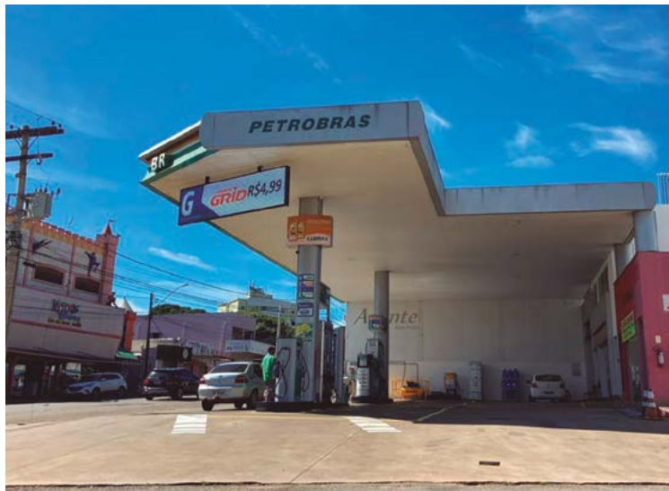
Empresário tem liberdade para praticar o preço que desejar e, por isso, há variações entre os diversos postos; como sempre, o ideal é pesquisar

Confaz decidiu por elevação do ICMS sobre o produto em 15 centavos, o que vai mexer diretamente no bolso do consumidor final