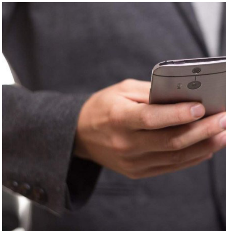
74% da população com mais de 10 anos, 130 milhões de pessoas têm acesso à internet no País

buir panfletos no centro da cidade, distribuir material de campanha, agora, com a internet e a possibilidade de impulsionamentos nas redes, ele vai atingir muito mais gente em muito menos tempo. De algumas eleições para cá, inclusive, os candidatos e partidos já perceberam que o investimento maciço deve ser em propaganda digital."